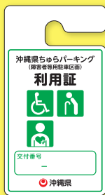
その他の障害者、 高齢者など