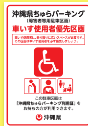
車いす使用者優先区画