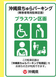
プラスワン区画 (障害者・高齢者・妊産婦など優先)