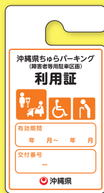
妊産婦、一時的な けが人など